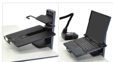
Laptop Kit ACS-98