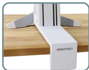
MORSETTO DA SCRIVANIA SI ATTACCA AL BORDO DELLA SUPERFICIE CON SPESSORE DA 1,2 - 6 CM