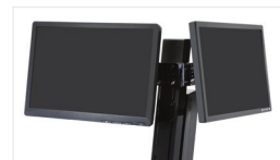
Dual Monitor Double-Hinged Bow #ACS-159 98-101-009 (NERO) Upgrade an existing dual monitor WorkFit with the ultimate in viewing-angle control (Compatible with #PLTSP-2, #PLTSP-38 and #PLTSP-18W)