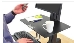
Superfici lavoro per WorkFit-S #ACS-184 97-581-019 (NERO) Aggiungi la superficie di lavoro a WorkFit-S Dual (Compatibile con #PLTSP-2)