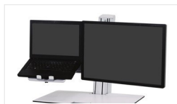
WorkFit, Kit di conversione: Dual to LCD & Laptop #ACS-01 97-938-062 (BIANCO) #ACS-0 97-617 (NERO) Converte un WorkFit-S, Dual in una workstation LCD e laptop (Compatibile con #PLTSP-2, #PLTSP-38 e #PLTSP-18W)