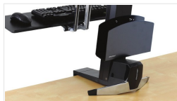
Small CPU Holder #ACS-118 80-063-200 (NERO)