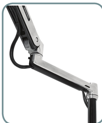
COPERCHIO A CLIP PER LA GESTIONE DEI CAVI POSTO SUL LATO INFERIORE DEL DEL BRACCIO PER GESTIRLI E NASCONDERLI ALLA VISTA